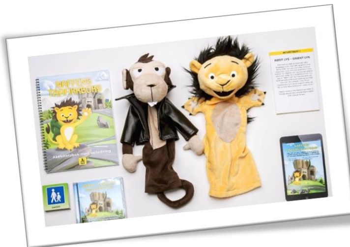
Naffens trafikkboks.